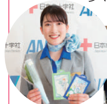
すずらんの香りが皆さんの回復の励みとなるよう願っています

5月21日、ANAグループ（全日本空輸株式会社）より当院に入院されている患者さんへ、爽やかなすずらんが香るしおりと、北海道千歳市近郊で栽培されているすずらんの切り花が届きました。これは1956年から続くANAグループの伝統的な社会貢献活動で、当院では富士山静岡空港が開港した2009年から始まり今回で16回目となるもの。今年は5年ぶりに客室乗務員より患者さんに直接しおりを贈呈。いただいた切り花は総合案内受付に飾られ、可憐な姿を多くの方に楽しんでいただきました。